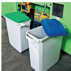
Der kan tilkøbes låg i flere forskellige farver