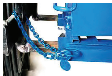
Sikkerhedskæde kan fås som tilbehør. Længde: ca. 1000 mm.