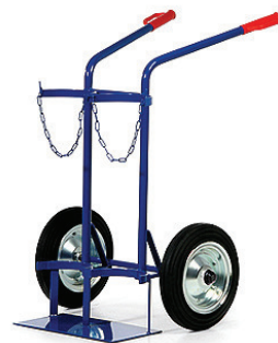
Ståflaskevogn t/20 el. 40 liters flasker