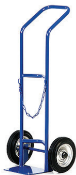
Ståflaskevogn t/10, 20 el. 40 liters flasker