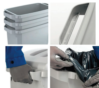
Ergonomisk og smart håndtering af sorteringsboksen