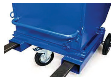
Vognene fås med to forskellige typer gaffellommer