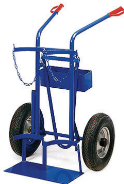
Ståflaskevogn t/20 el. 40 liters flasker