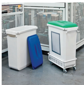
Sorteringsboksen kan placeres på vogn