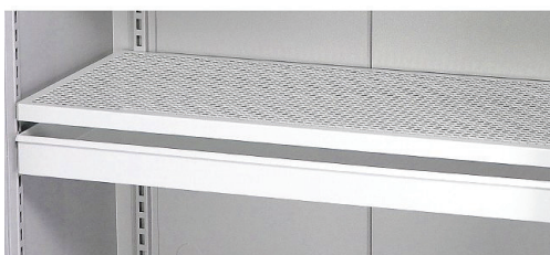
Perforeret hylde monteres m/spildbakke