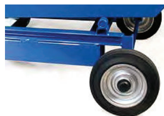
Kraftige massive gummi hjul sikrer stabil transport