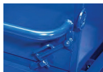
Sikring, som hindrer at containeren pludselig tipper

BLEVA stålkassevogne er produceret i høj kvalitet med en tipbar lukket kasse. Fås i størrelserne 250, 400 og 600 liter. Den største model er forstærket med ekstra kraftige stålrør.